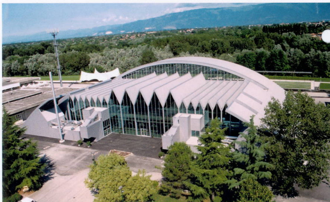
Immagini della Fiera di Pordenone, dove avrà luogo Sicam.

Abbiamo già ricevuto adesioni scritte dai principali marchi, che hanno confermato la validità della scelta di Pordenone e hanno anche manifestato la consapevolezza che oggi partecipare a una fiera è una scelta molto precisa di strategia aziendale, fondata su fattori molto concreti, il primo dei quali è l'aspettativa di un ritorno in termini commerciali. Inoltre le adesioni che ad oggi sono già pervenute suggeriscono ragionevoli certezze sul livello qualitativo di SICAM. Questo perché il rigore e la fermezza in sede organizzativa, se talora possono sembrare un inutile forzatura, sono a mio parere la chiave per assicurare gli espositori circa la reale qualità del prodotto fieristico che viene loro proposto.