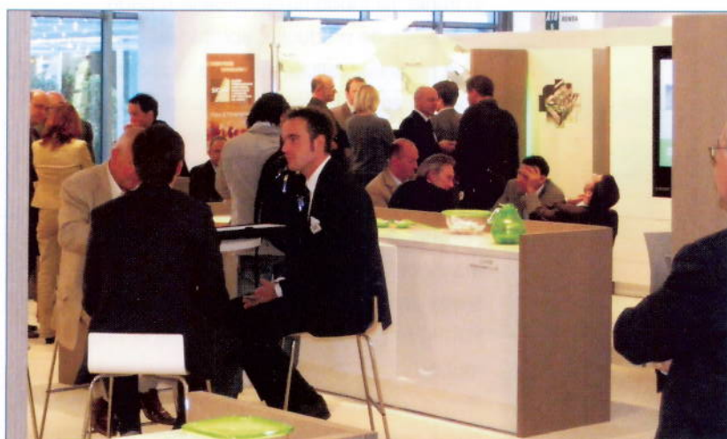
1. Pavilionul expozițional de la Pordenone

Jumătatea participanților străini sunt nume mari din Germania, urmați fiind de cei din Austria și Turcia. La expoziție s-au înscris atât companii multinaționale, cât și întreprinzători de talie medie sau mică. Cele mai bine reprezentate state sunt: Germania, Austria, Elveția, Turcia, Spania și Marea Britanie. Premisele sunt încurajatoare, astfel că organizatorii spun că munca lor nu s-a terminat. Ei așteaptă o avalanșă de vizitatori, mai mare sau cel puțin la fel ca la ediția de anul trecut, atunci când aproximativ 13250 din 79 de țări au venit la Pordenone Fiere. "În ciuda acestor rezultate nu ne odihnim pe laurii victoriei. Târgurile sunt structuri vulnerabile, mașinării care trebuie să ofere servicii de înaltă calitate. Trebuie organizate în așa fel încât, expozanții să nu aibă altă grijă decât propria afacere. Este nevoie, de asemenea, de o intensă promovare pentru a câștiga noi expozanți,